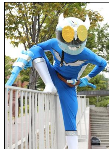
吹田非公式ヒーロー クワイダー