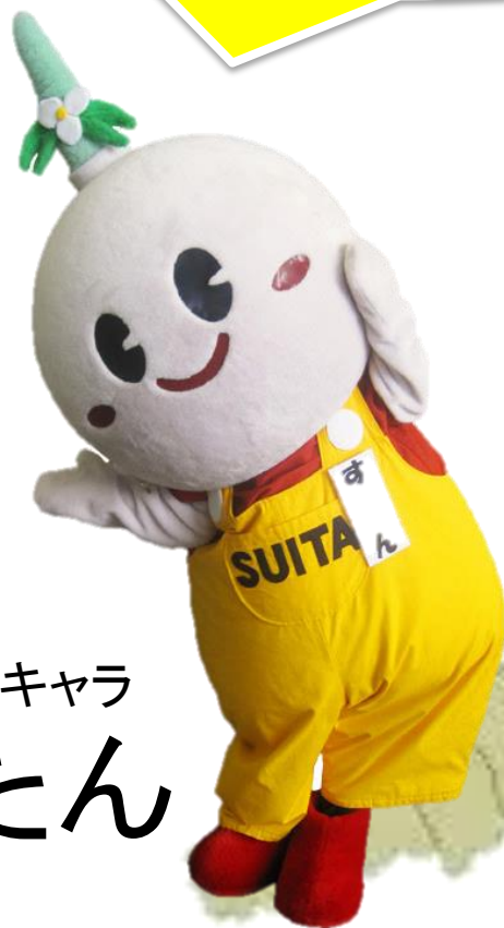
吹田公式ゆるキャラ すいたん